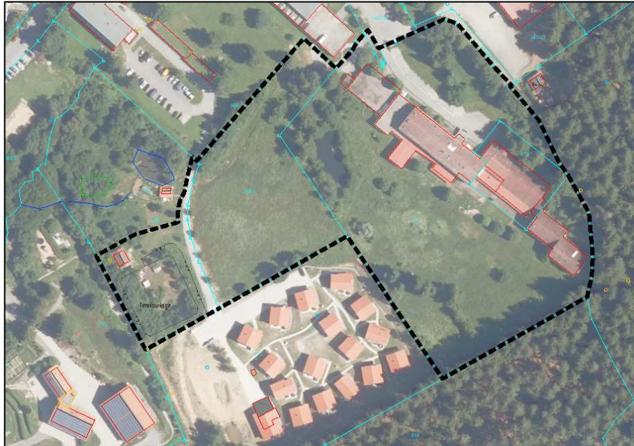
Übersichtsplan Plangebiet mit Geltungsbereich (Strichlinie schwarz)

Das Plangebiet befindet sich im Osten von Sankt Englmar unmittelbar südlich der Straße „Am Predigtstuhl“. Der Geltungsbereich des Deckblattes Nr. 14 zum Flächennutzungsplan mit landschaftsplan umfasst eine Gesamtfläche von insgesamt ca. 32.045 m 2 (ca. 3,2 ha) und wird gebildet aus den Flurnummern 363/39 (Tfl.), 394 (Tfl.), 394/1, 513 und 513/1 Gemarkung Sankt Englmar.