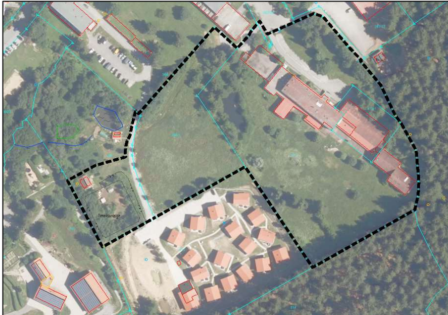
Übersichtsplan Plangebiet mit Geltungsbereich (Strichlinie schwarz)

Das Plangebiet befindet sich im Osten von Sankt Englmar unmittelbar südlich der Straße „Am Predigtstuhl“. Der Geltungsbereich des Deckblattes Nr. 14 zum Flächennutzungsplan mit landschaftsplan umfasst eine Gesamtfläche von insgesamt ca. 32.045 m 2 (ca. 3,2 ha) und wird gebildet aus den Flurnummern 363/39 (Tfl.), 394 (Tfl.), 394/1, 513 und 513/1 Gemarkung Sankt Englmar.