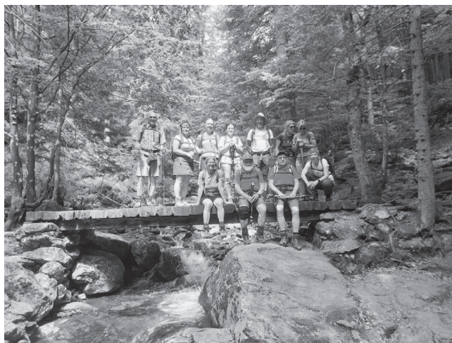
Die Wanderer an den Rieslochfällen