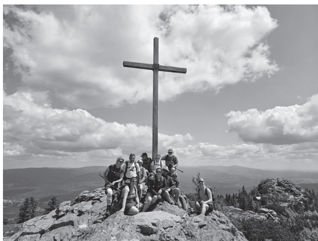
Die Gruppe auf dem Gipfel des Großen Arber