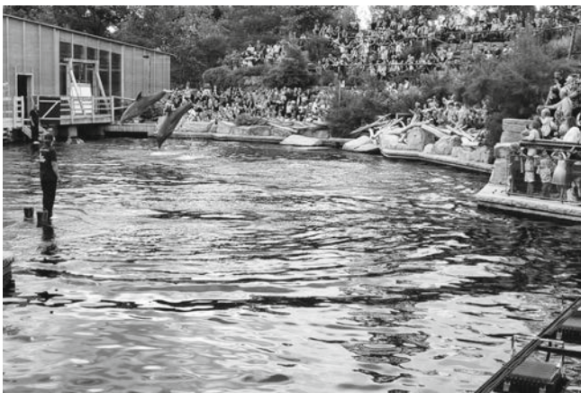
Die Sankt Englmarer waren begeistert von der Delfinshow.