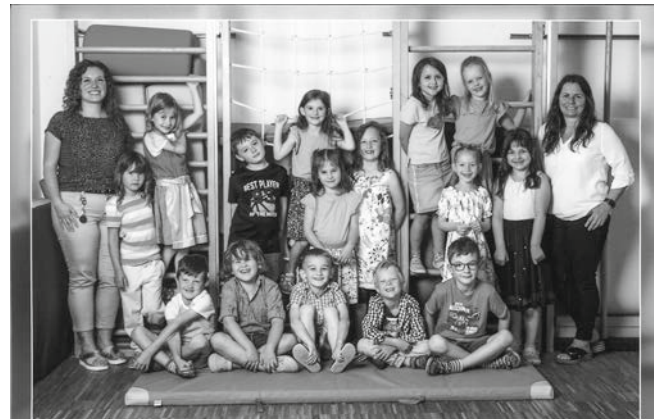
Kindertagesstätte St. Englmar

Das gesamte Personal wünscht den Schulanfängern viel Freude und Erfolg in der Schule.